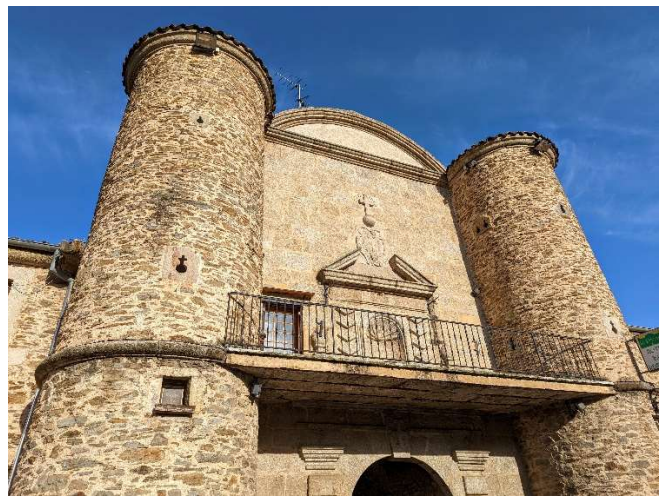
*La cour des frères ou des obédiences